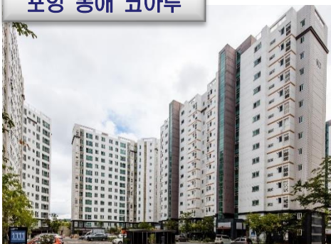
포항 동해 코아루