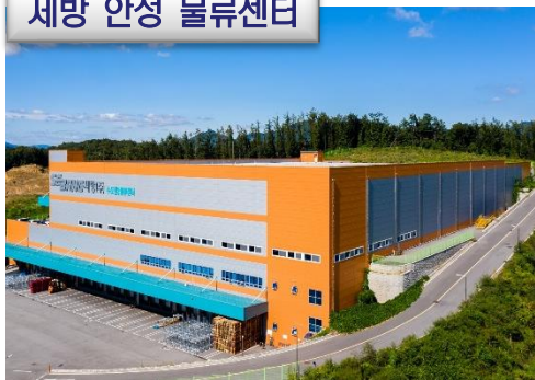
세방 안성 물류센터