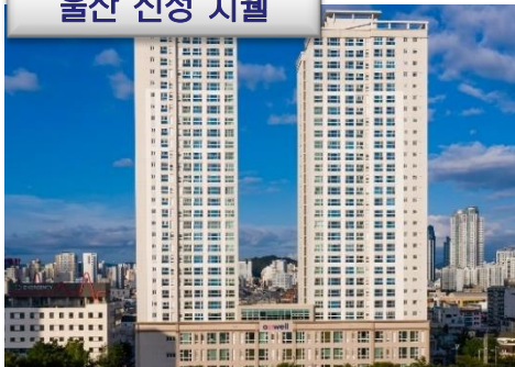
울산 신정 지웰