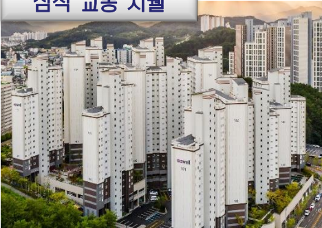
삼척 교동 지웰