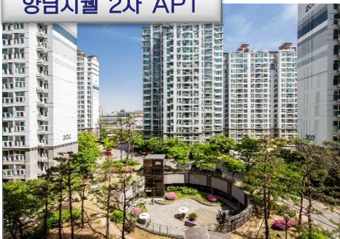
향남지웰 2차 APT