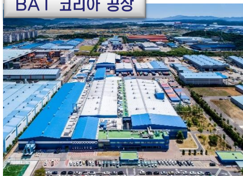
BAT 코리아 공장