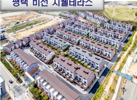
평택 비전 지웰테라스