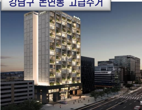
강남구 논현동 고급주거