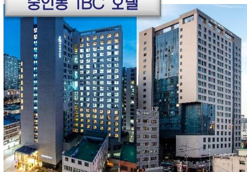
송인동 IBC 호텔