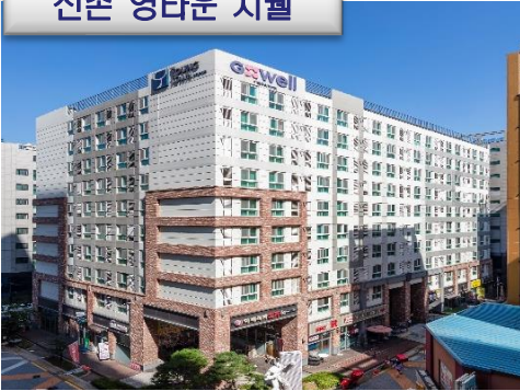
신촌 영타운 지웰