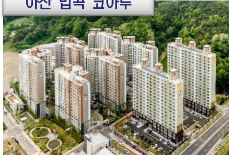
아산 법곡 코아루